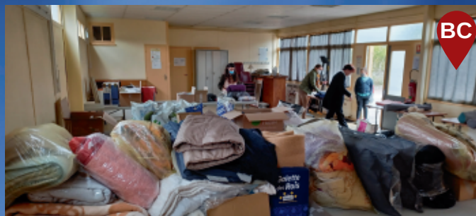
Les Buissonnais au rendez-vous de la solidarité.