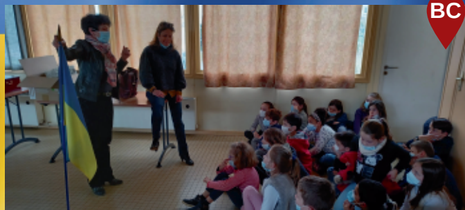
Les écoliers venus participer ont été sensibilisés à l'action.