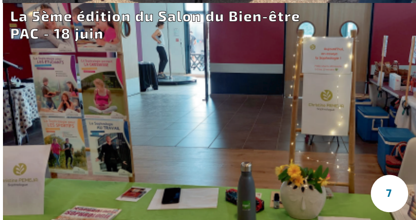
La 5ème édition du Salon du Bien-être PAC - 18 juin