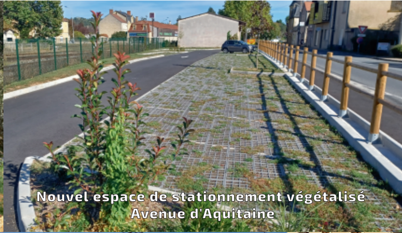
Nouvel espace de stationnement végétalisé Avenue d'Aquitaine