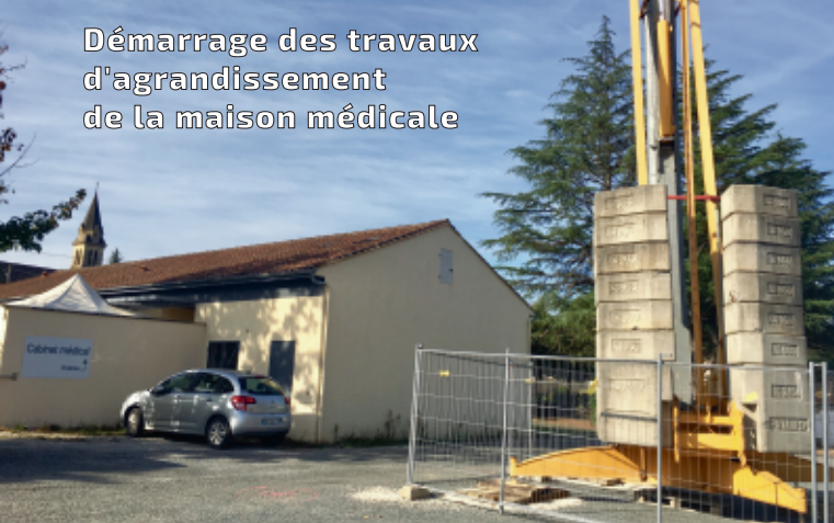
Démarrage des travaux d'agrandissement de la maison médicale