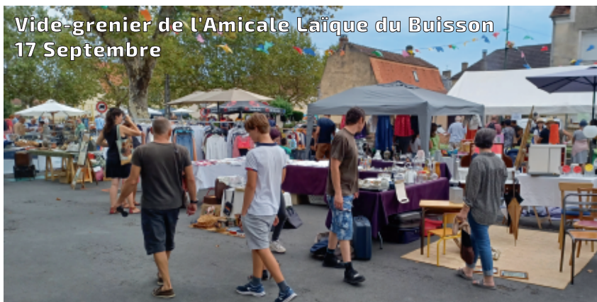
Vide-grenier de l'Amicale Laïque du Buisson 17 Septembre