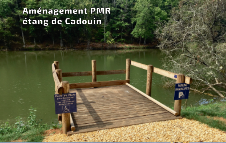
Aménagement PMR étang de Cadouin