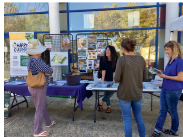
Fête du Sol vivant - 7 octobre