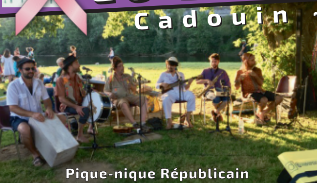
Pique-nique Républicain Spectacle du 14 juillet