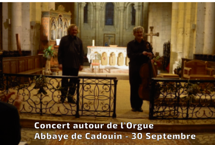
Concert autour de l'Orgue Abbaye de Cadouin - 30 Septembre

Le traditionnel vide-greniers s'est déroulé dimanche 9 juillet sur les places et dans les rues de Cadouin. De nombreux visiteurs ont flâné le long des 300 mètres de stands proposés par la soixantaine d'exposants présents.