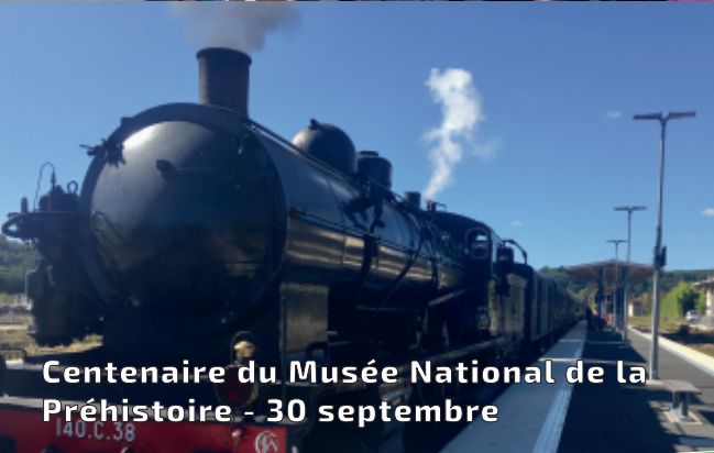
Centenaire du Musée National de la Préhistoire - 30 septembre