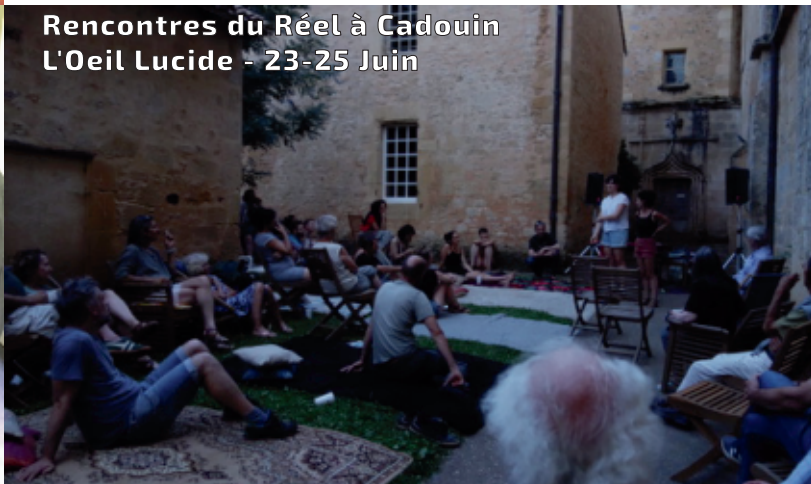
Rencontres du Réel à Cadouin Oeil Lucide - 23-25 Juin