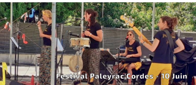
Festival Paleyrac Cordes - 10 Juin