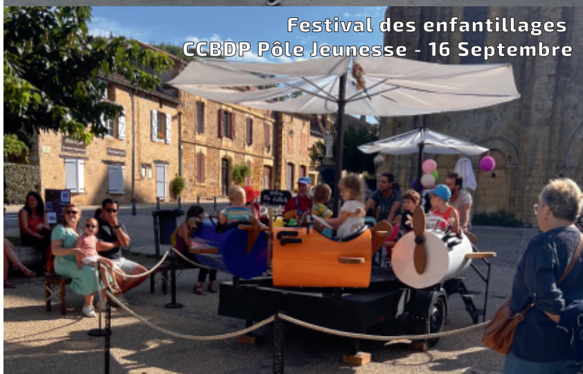
Festival des enfantillages CCBDP Pôle Jeunesse - 16 Septembre