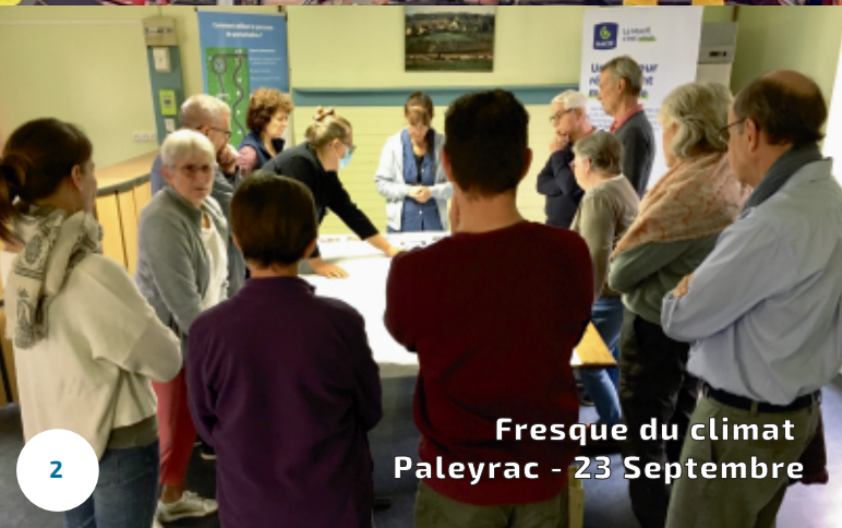
Fresque du climat Paleyrac - 23 Septembre